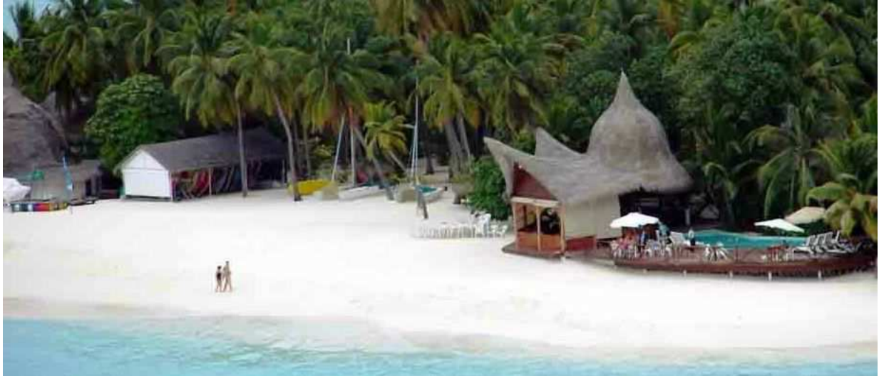
A sziget látképe a távolabbi korallzátonyról nézve .

ADMIRAL TRAVEL utazási iroda : email: info@admiraltravel.hu www.maldiv-szigetek.info