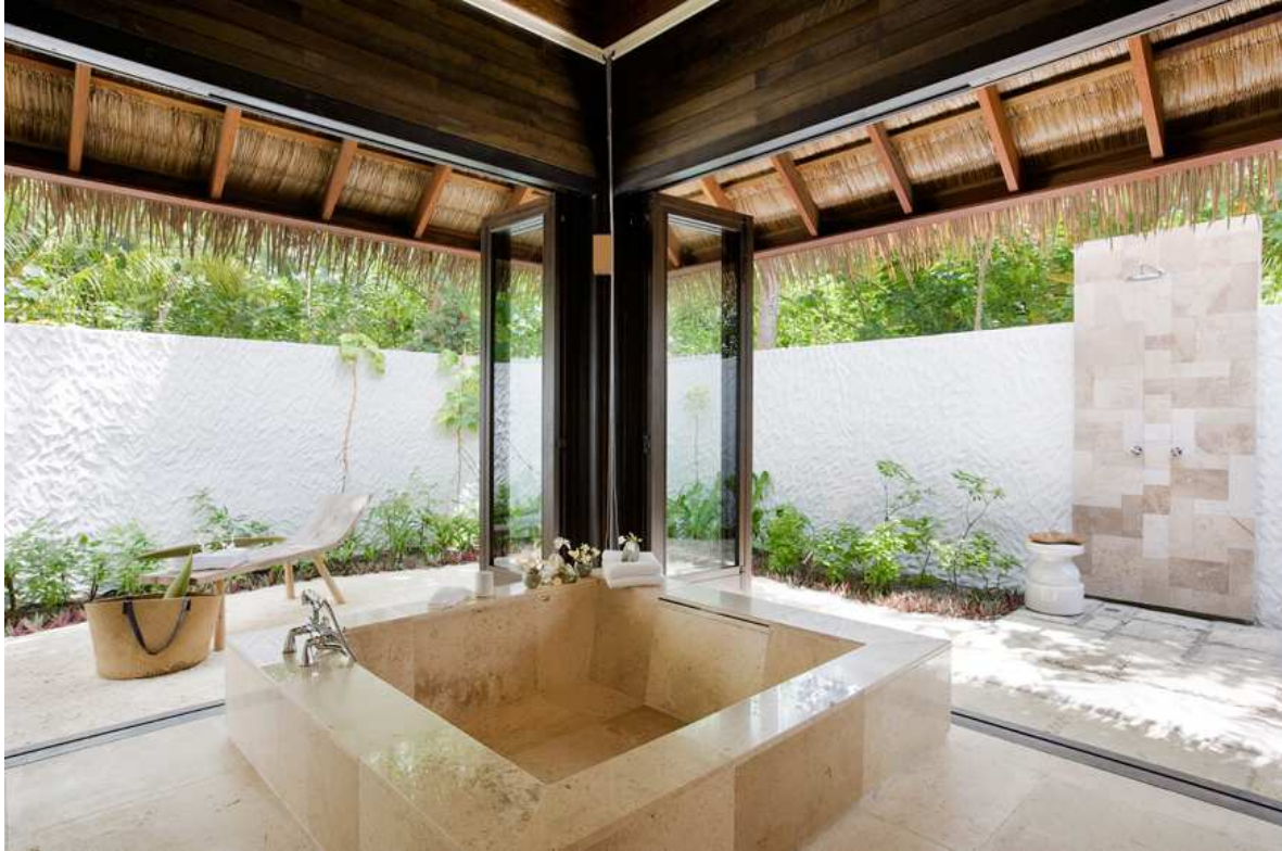
Beach Suite saját medencével (kb 101 nm), közvetlen partnál.