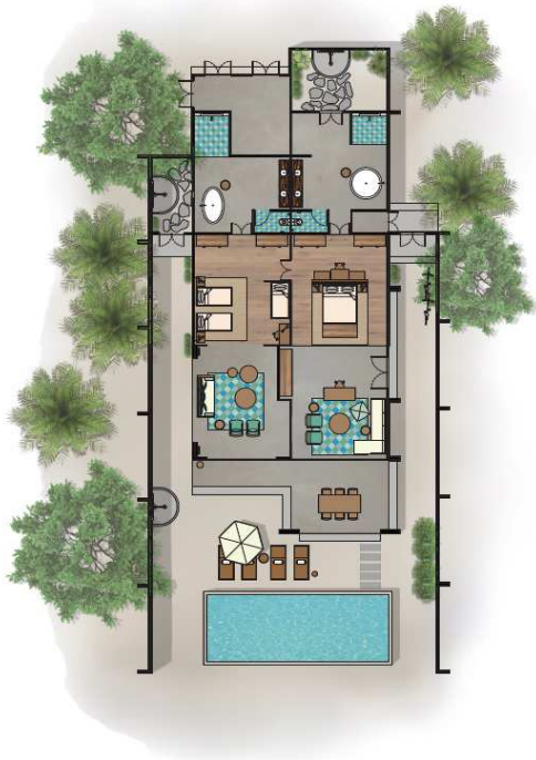
Amilla AMILLA FUSHE | BAA ATOLL | MALDIVES FAMILY BEACH HOUSE | SIZE: 600 sqm | NUMBER OF UNITS: 4

Az árban benne. Fitness centrum, Yoga , világítás tenispálya, Széllovas , Wakeboard, kajak, asztalitenisz. Fizetős a motorizált vízi sporteszközök valamint a SPA kezelések, búvárközpont, kirándulások.